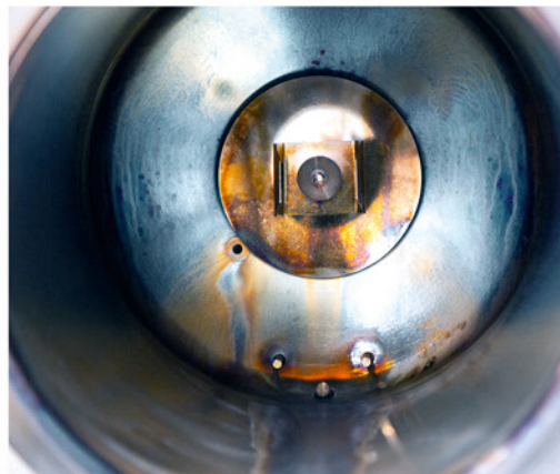
Ohne regelmäßige Kesselreinigung